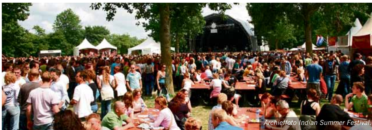
Archieffoto Indian Summer Festival.

*Regio Alkmaar: gemeenten Alkmaar, Bergen (NH.), Heerhugowaard, Heiloo, Langedijk, Schermer. Bron: Langedijk in cijfers, www.gemeentelangedijk.nl