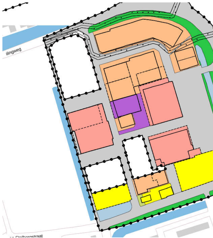
Afbbeelding 3: uitsnede bestemmingsplan 'Veilingterrein oost, Noord-Scharwoude' (IMRO: NL.IMRO.0416.BPVTO2014-va02)

van Langedijk is vastgesteld. De bestemming van deze gronden is Bedrijf, Detailhandel, Gemeengd en Verkeer.