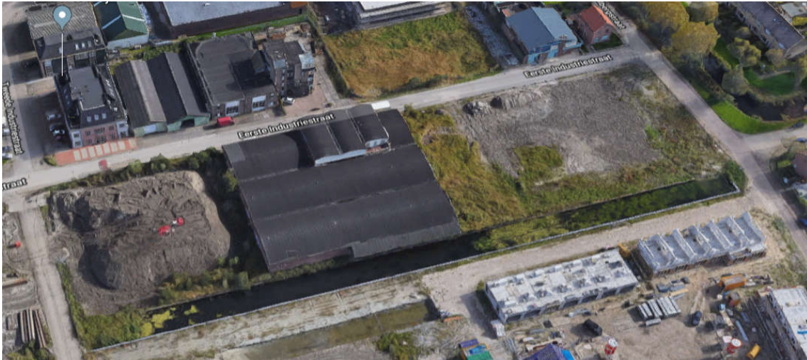
Afbeelding 4: Luchtfoto bestaande situatie (het gebouw De Drie Bogen is nog te zien maar recent gesloopt)

Het plangebied van dit bestemmingsplan heeft betrekking op een aantal percelen binnen het oostelijk deel van het voormalige veilingterrein. Dit gebied kenmerkt zich hoofdzakelijk door braakliggende gronden en een combinatie van wonen en werken. Het plangebied heeft betrekking op gronden waar de voormalige bedrijfsbebouwing reeds gesloopt is, en de gronden van het perceel aan de Industriestraat waar het gebouw "De Drie Bogen" was gesitueerd. Dit gebouw stond al jaren leeg en is recent gesloopt. Tevens zijn de percelen van het aanwezige staalbouwbijbedrijf aan de Industriestraat 16b en het gebouw aan de Industriestraat 16 in dit bestemmingsplan opgenomen.