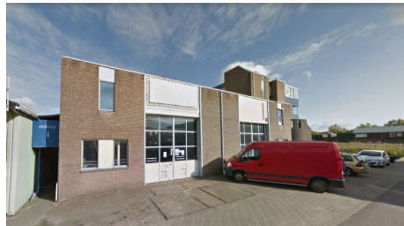
Afbeelding 5: Foto's bestaande situatie (het gebouw De Drie Bogen is nog te zien maar recent gesloopt)