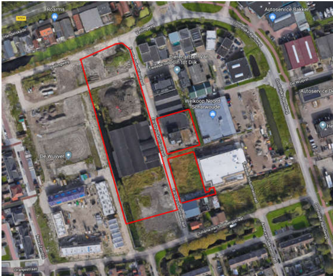
Afbeelding 2: Luchtfoto met begrenzing plangebied

De begrenzing van het plangebied in dit bestemmingsplan is iets ruimer opgenomen dan de door de AbRS vernietigde plandelen. De reden hiervoor is dat de voorgenomen verhuizing van het detailhandelsbedrijf Combitex naar het “gebouw met de drie bogen” geen doorgang krijgt en het gebouw daarom geen detailhandelsfunctie zal krijgen. Het voornemen is om het gebouw te slopen en woningen (westzijde) en lichte bedrijvigheid in combinatie met woningen (oostzijde) te realiseren. In de nieuwbouw dient het waardevolle, karakteristieke gevelbeeld van het gebouw terug te komen. Daarnaast is het perceel van het aanwezige staalbouwbedrijf (Industriestraat 16b) en het ten zuiden hiervan gesitueerde gebouw (Industriestraat 16) in het plangebied opgenomen. De gronden van Industriestraat 16b en 16 zijn aangekocht door een ontwikkelende partij met het plan om woningbouw te plegen. Het staalbouwbedrijf zal uit het gebied worden verplaatst. Met de sloop van beide panden worden mogelijkheden gecreëerd voor de realisatie van woningen op deze locaties.