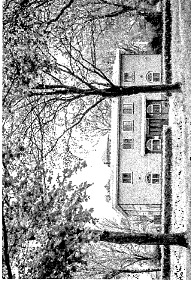
De Al-Mohsinin moskee aan de Potjesdam.

Hij erkent dat er in 2010 bij de Saudi-sche ambassade in Den Haag een aanvraag ingediend is over financi-