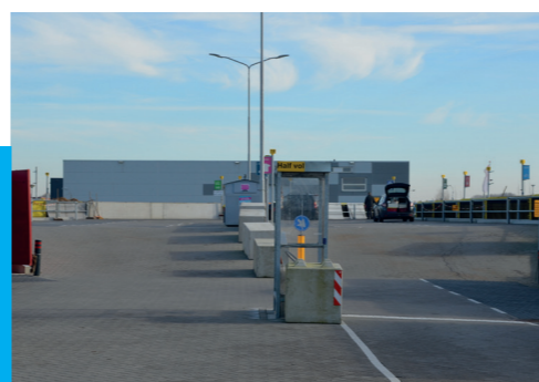
Afvalbrenngstation in Oudkarspel