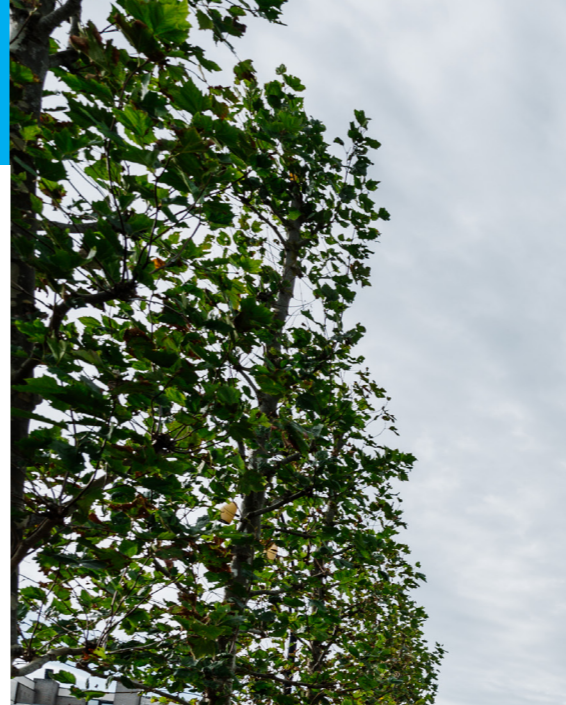
Gemeentehuis in Heerhugowaard >