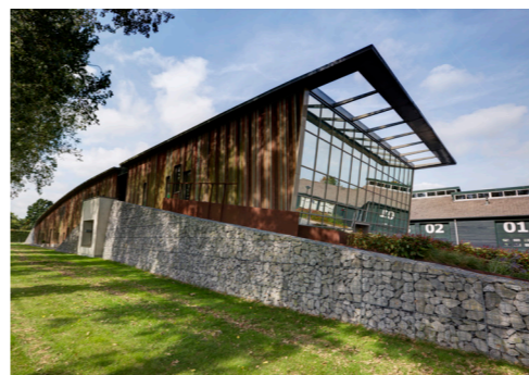
Gemeentewerf in Heerhugowaard