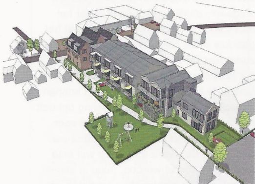
Artist impression centrumplan Sint Pancras Kerssens de Ruiter Architecten