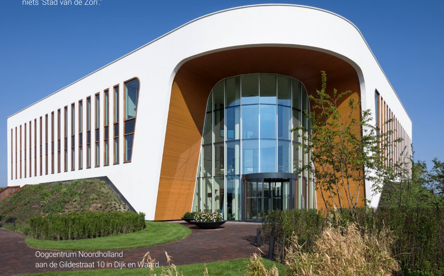
Oogcentrum Noordholland aan de Gildestraat 10 in Dijk en Waard.

“De gemeente en de markt bepalen natuurlijk wat er komt. Ik hoop op bedrijven met een regionale aantrekkingskracht. High end expertisecentra waarvoor mensen willen reizen. Vergelijk het met de High Tech Campus in Eindhoven. Gastvrij, duurzaam en in een aantrekkelijk groen verblijfsgebied.”